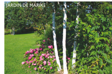
JARDIN DE MARIKE