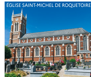
ÉGLISE SAINT-MICHEL DE ROQUETOIRE