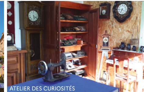
ATELIER DES CURIOSITÉS